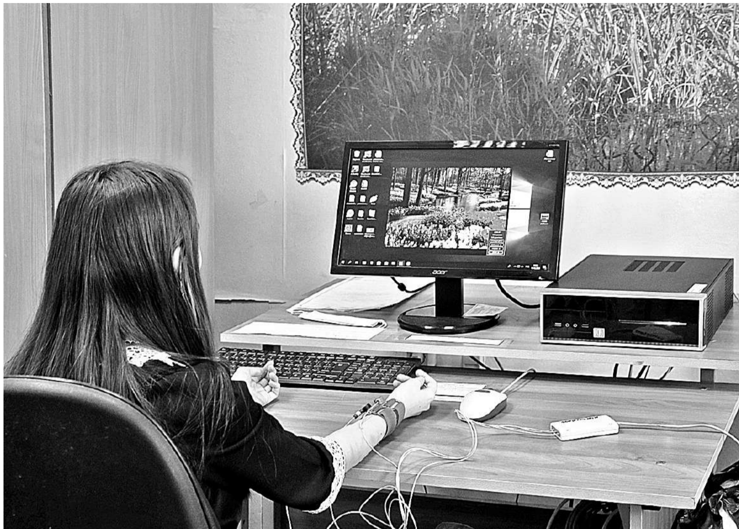
На занятии в кабинете БОС-здоровье

КАК КОРОЧАНСКАЯ ШКОЛА-ИНТЕРНАТ ДАЁТ ПУТЁВКУ В ЖИЗНЬ ДЕТЯМ С НАРУШЕНИЯМИ РЕЧИ