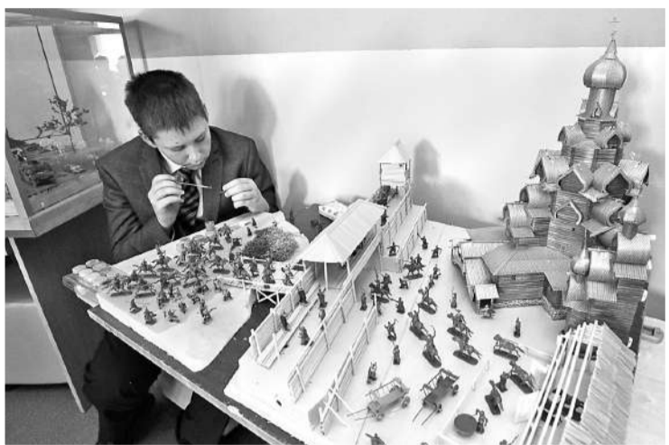
Вот такой макет старинной крепости ребята сделали своими руками