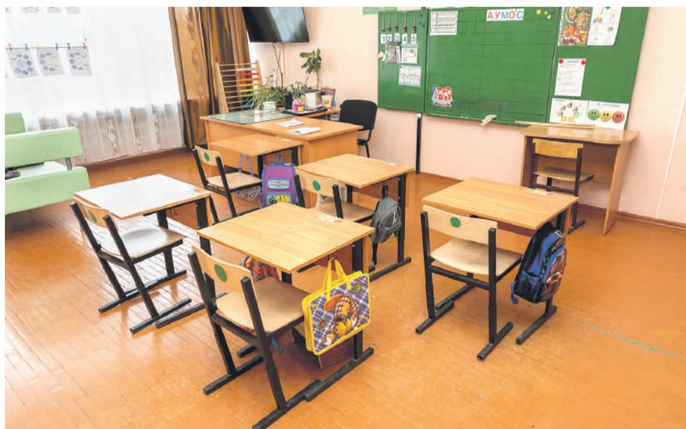
Класс для учеников с тяжёлыми интеллектуальными отклонениями

В комнате живут по двое. Как правило, неделю, потом «жильцы» меняются. Здесь у ребят есть