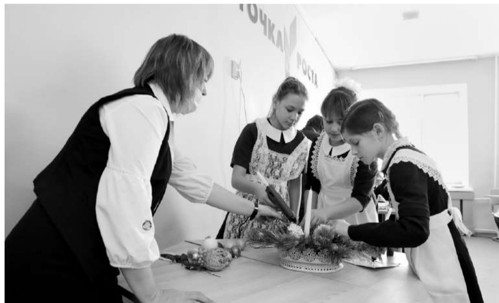
Девочки из кружка «Станем волшебниками» за несколько минут создали новогоднюю композицию