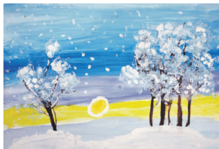
«Снег». Рисунок Юрия Кривокустава (руководитель Дина Кислиця)