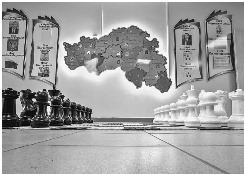
Оформление стен в Коцеевской школе Корочанского района