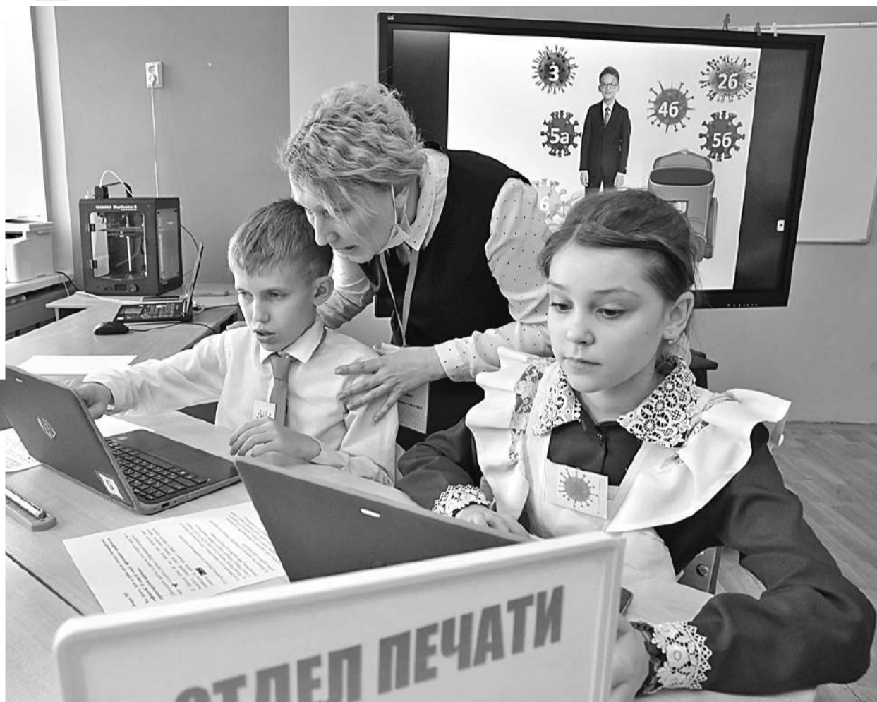
Отделу печати поставлена задача: найти информацию по профилактике коронавируса