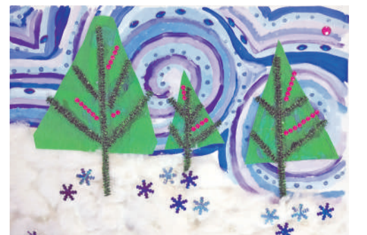
Коллективная работа объединения «Бумажные фантазии»