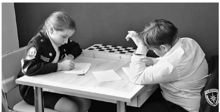
Рассчитать ценность шахматных фигур — задача нелёгкая