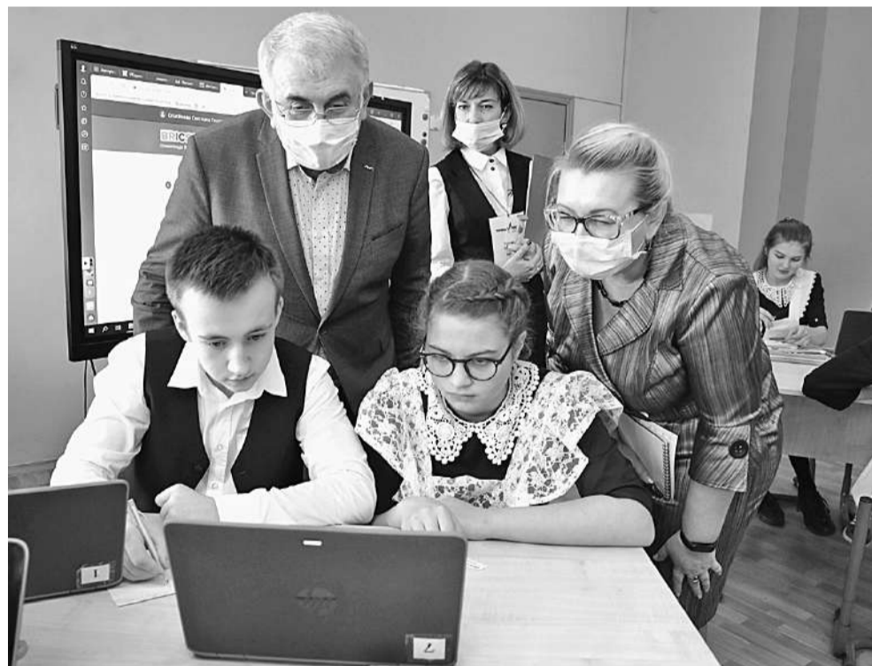
Решать олимпиадные задачи на платформе «Учи.ру» интересно и полезно!