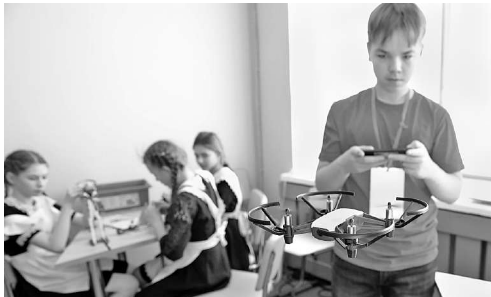
Запуск квадрокоптеров — любимое занятие мальчишек