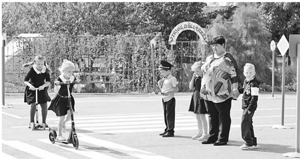
В «Автогородке» школьники на практике учат Правила дорожного движения