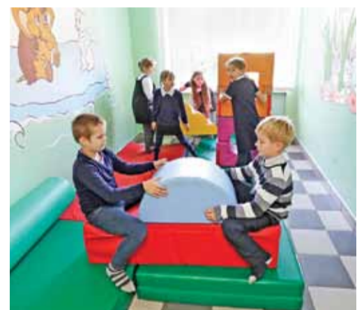
Игровая зона для младшеклассников в Курасовской школе

Сельские школы Белгородской области доказали: даже в маленькой школе можно так организовать учебно-воспитательный процесс, что ученики городских школ будут завидовать сверстникам из маленьких населённых пунктов. Смотрите сами: в сельских школах больше пространства, которое можно использовать для развития детей. У них и территория побольше, чем у городских, — значит, можно не просто газоны, а целые парки и дендрарии обустроить. Не говоря уже об опытных участках. Оснащаются многие сельские школы на самом высоком уровне, потому что участвуют во многих федеральных и региональных проектах. И учителя в небольших школах работают опытные и доброжелательные. Так что уже можно начинать завидовать школьникам из сёл и посёлков.