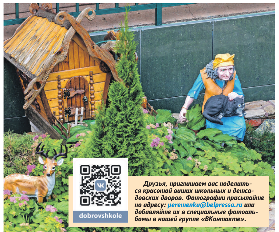
Школа № 41 г. Белгорода