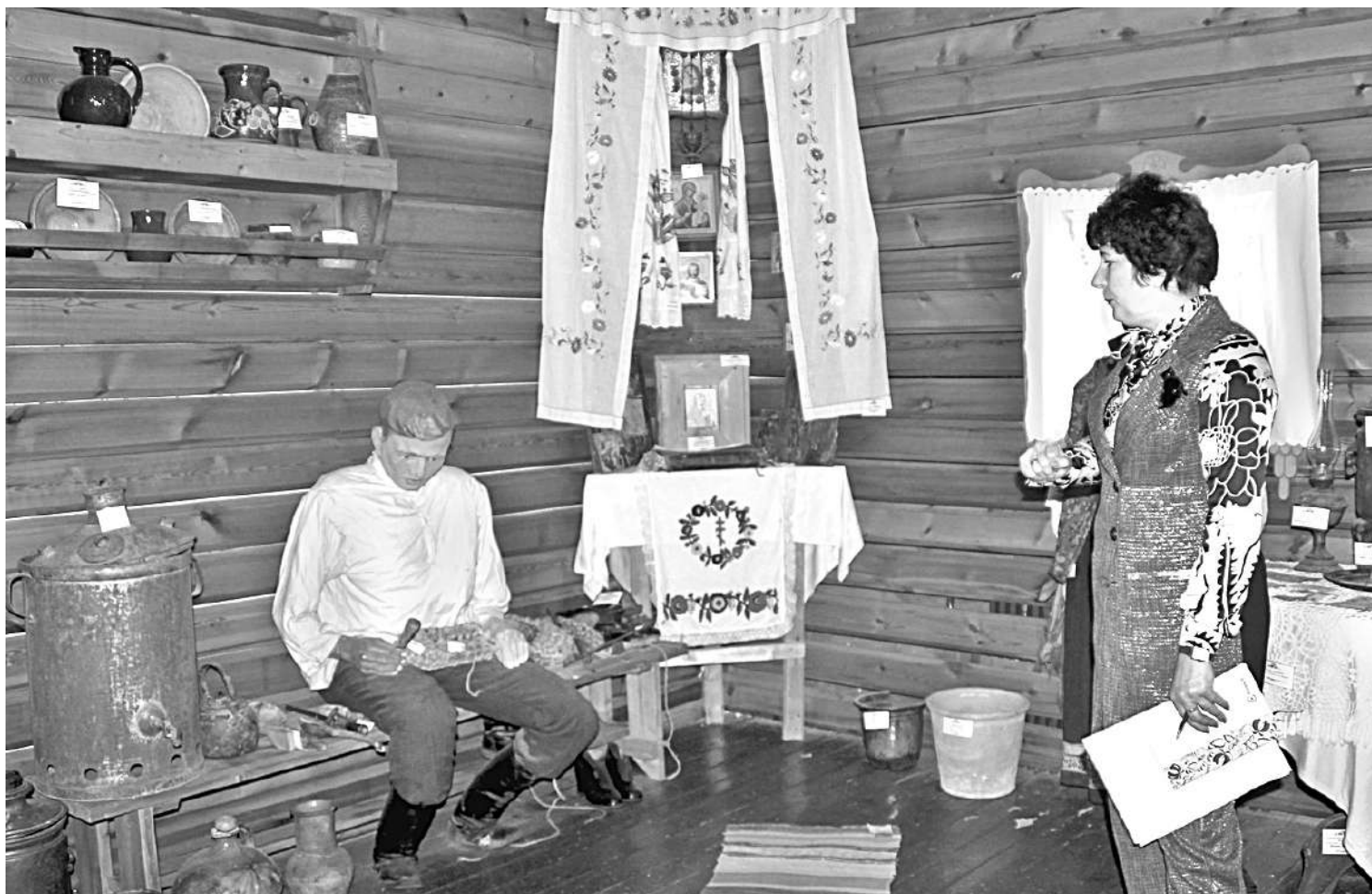
В школьном музее этнографии

НО ДАЖЕ САМОЕ КРАСИВОЕ, ПУСТЬ И ДОБРОЖЕЛАТЕЛЬНОЕ ОФОРМЛЕНИЕ МОЖЕТ СТАТЬ БЕСПОЛЕЗНЫМ, БЕЗДЕЙСТВЕННЫМ,