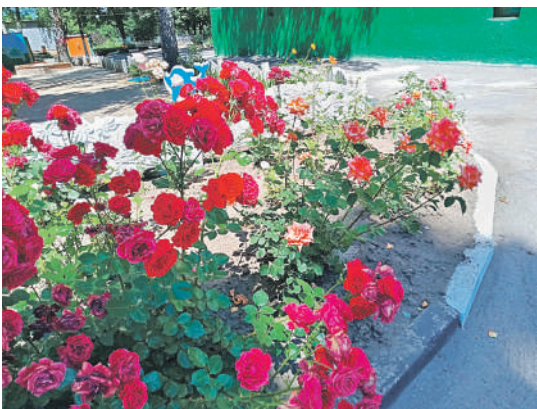
Детсад № 48 «Вишенка» г. Белгорода