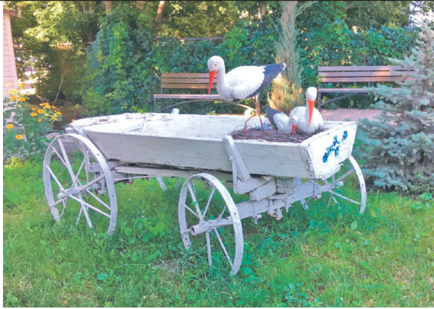
Центр образования № 1 г. Белгорода