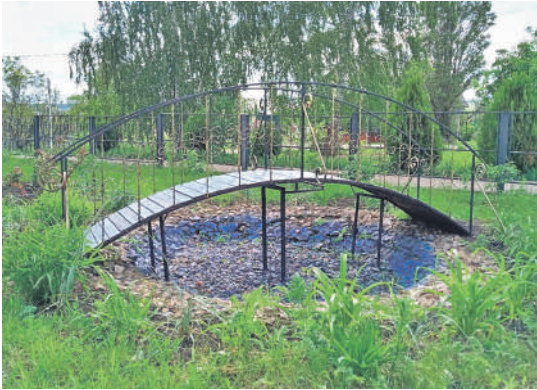
Уразовская школа № 2 Валуйского городского округа