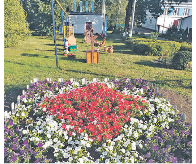
Старобезгинская школа Новооскольского городского округа