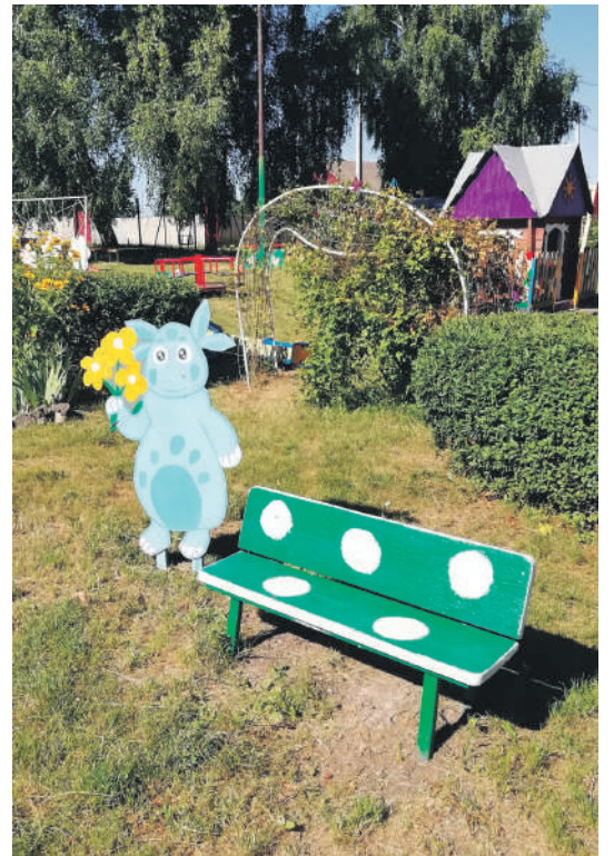
Детсад № 4 с. Алексеевка Корочанского района