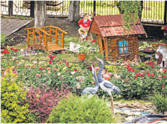
Школа № 41 г. Белгорода