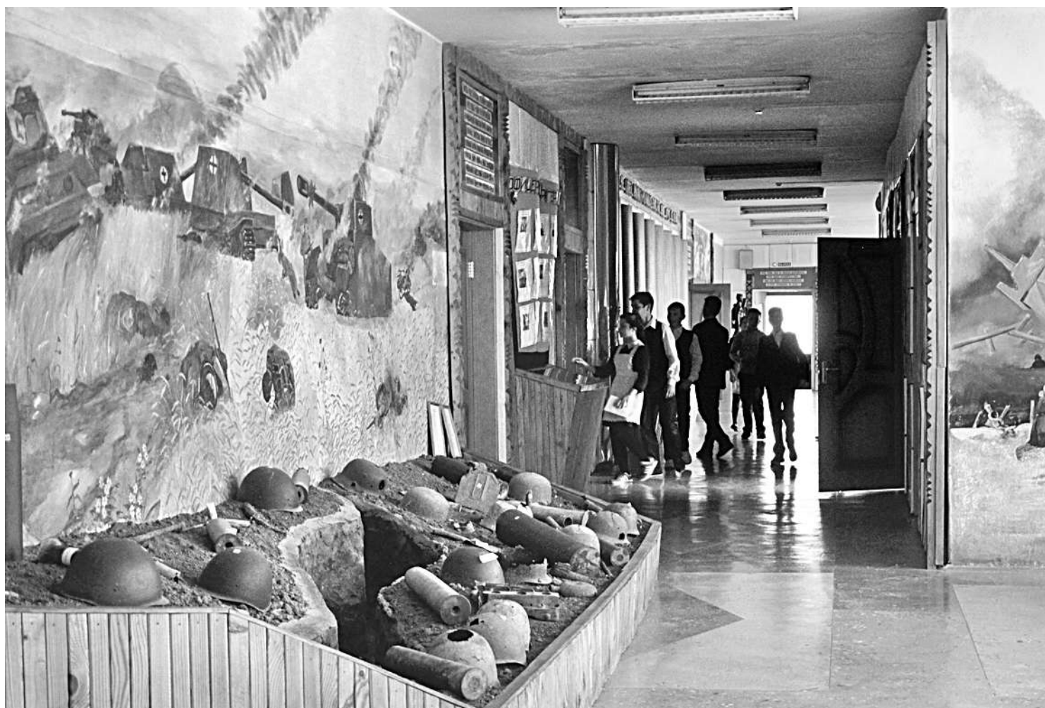
Школьный музей Великой Отчужденной войны