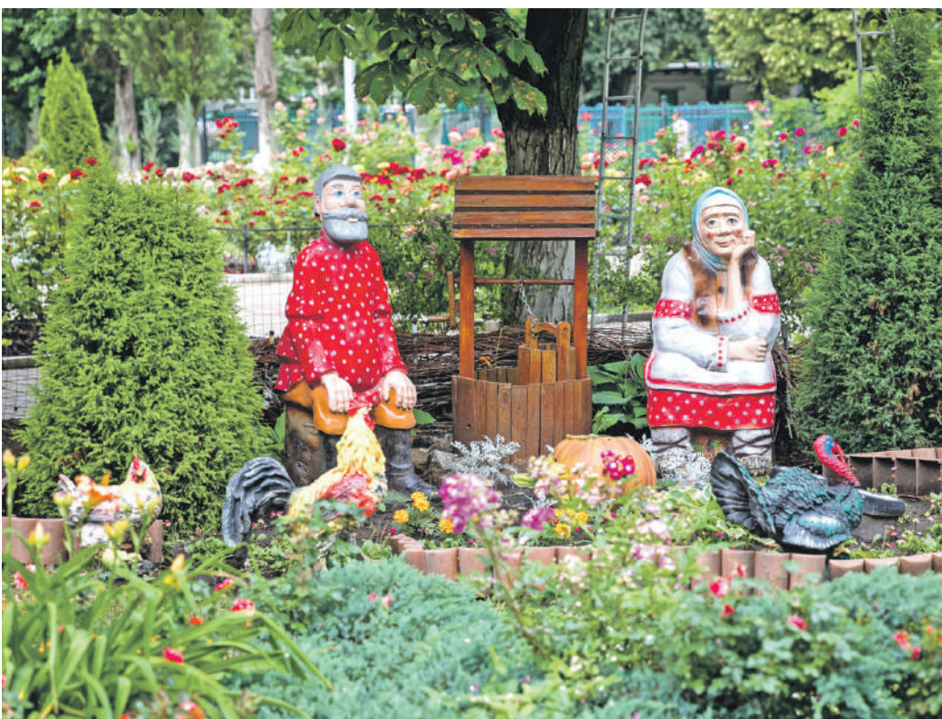
Школа № 41 г. Белгорода