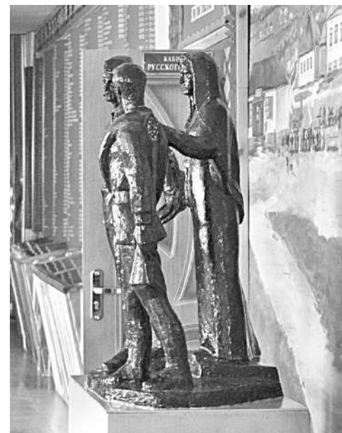
Школьный музей Великой Отечественной войны

Уверена в том, что в школе всегда ведущей и главной должна быть функция воспитания, ответственности за формирование человеческой личности. В детях необходимо формировать нравственные принципы, делая это незаметно и каждодневно. В нашей школе детей и педагогов связывают