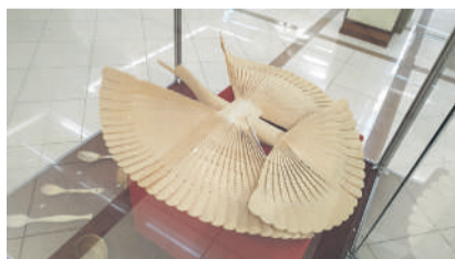
Архангельская щепная птица