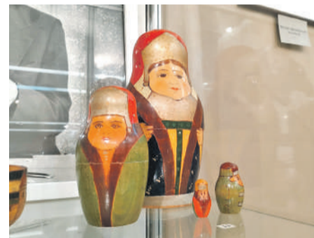
Набор матрёшек «Боярыни» (1910-е гг.)