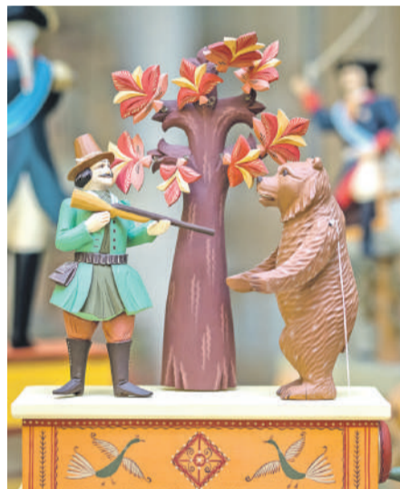
Деревянная игрушка «Охотник и медведь» мастера Олега Михайлова