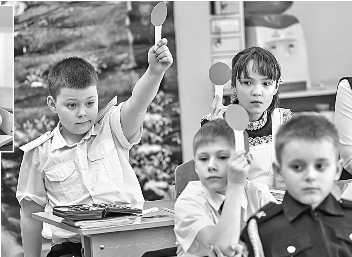
Использование техники «Светофор» в начальной школе

Задания разные: схемы, вопросы (в том числе в формате «допиши фразу или предложение») и даже ребусы. Выполнить их ребята должны за определённое