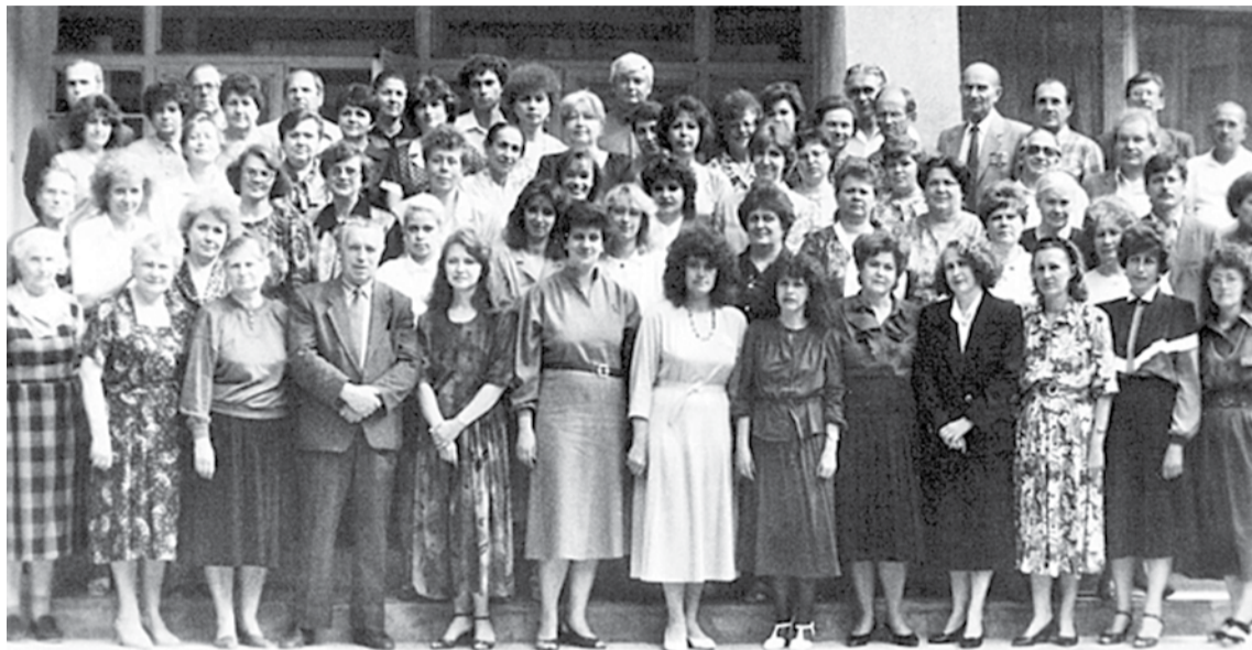
Коллектив Белгородского областного института усовершенствования учителей, 1994 год

Благодаря профессионализму, преданности своему делу, большому трудолюбию, таланту преподавателей, педагогов институт развивался, успешно выполняя свою главную миссию — повышать качество образования Белгородской области. Сегодня наш институт обладает высоким потенциалом, компетентным и работоспособным профессорско-преподавательским составом, который полон творческих планов и замыслов. Надеюсь, что всё это позволит нам эффективно реализовывать как региональные, так и федеральные инициативы. Желаю всем преподавателям и сотрудникам Белгородского института развития образования радости, профессиональных побед, счастья и любви близких, душевного равновесия, интересного и плодотворного учебного года!