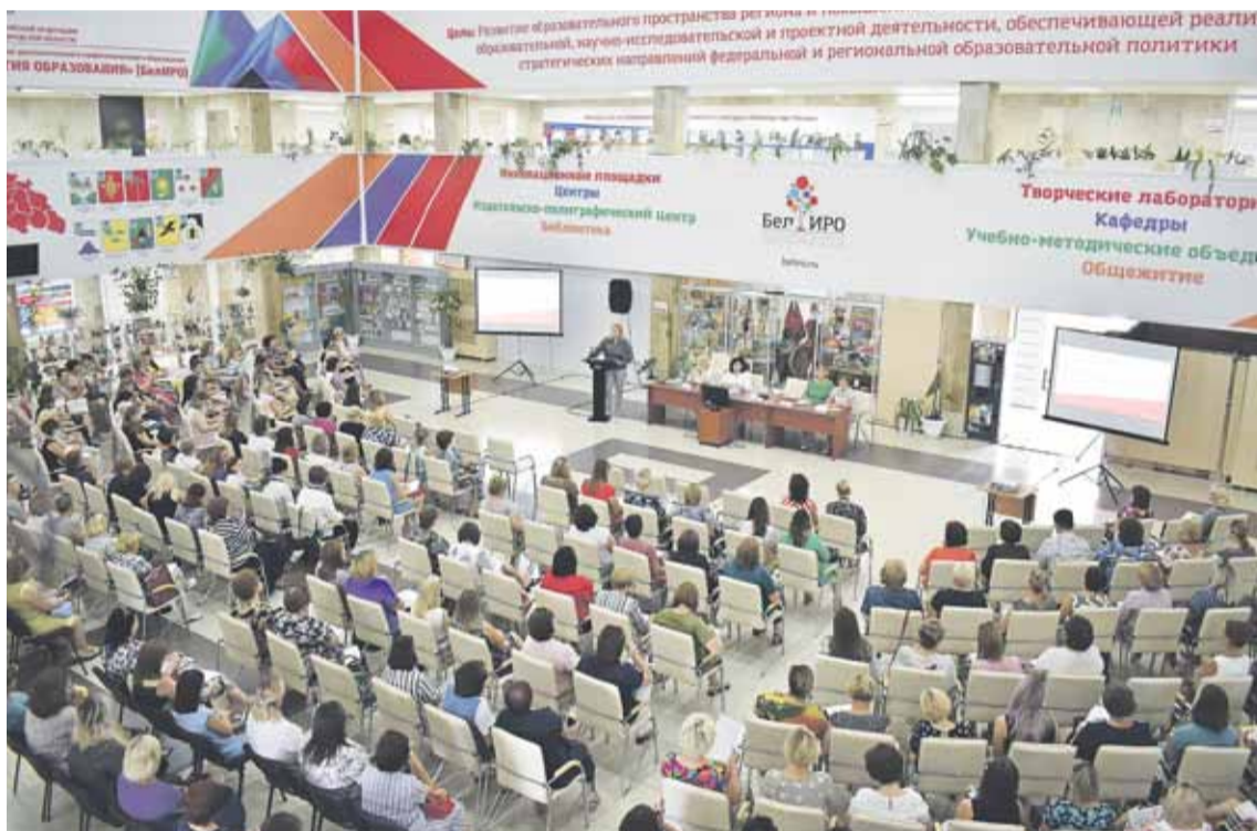
Современный, методически и технологически оснащённый центр непрерывного образования