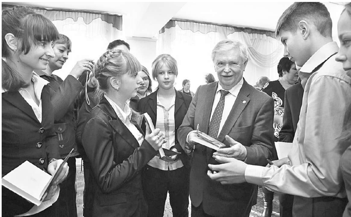
Альберт Лиханов в Грайворонской районной библиотеке

ПОЧЕМУ ЧИТАТЕЛЕЙ ПРОИЗВЕДЕНИЙ АЛЬБЕРТА ЛИХАНОВА МОЖНО НАЗВАТЬ НРАВСТВЕННЫМИ ЛЮДЬМИ