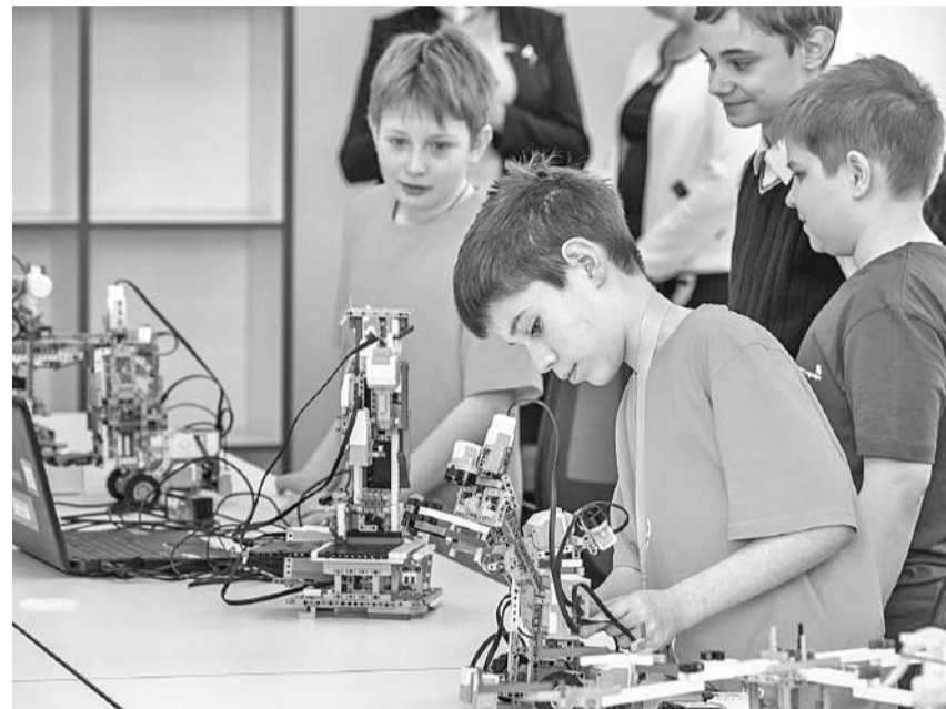
Студия робототехники Шуховского лицея